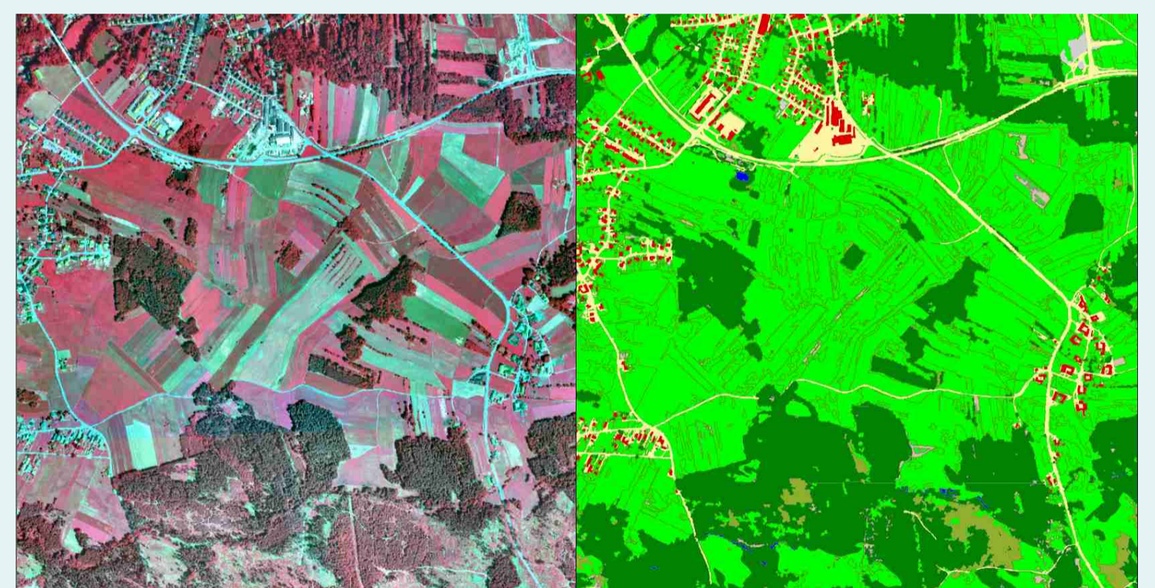
Orthofoto und Landbedeckungskartierung