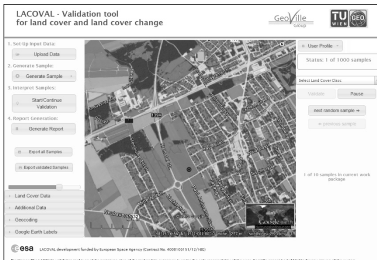
Abb. 2: LACOVAL Portal – LISA Landbedeckungsdaten im Gebiet Traun/OÖ

dierungen definiert werden. Die Definition kann entweder direkt aus dem zuvor definierten Landbedeckungsdatensatz abgeleitet und übernommen oder alternativ mittels Polygon auf einer Karte definiert werden.